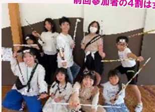
前回参加者の4割は女の子